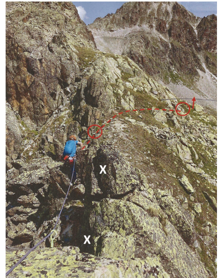
Abstieg durch das zweite (!) Couloir