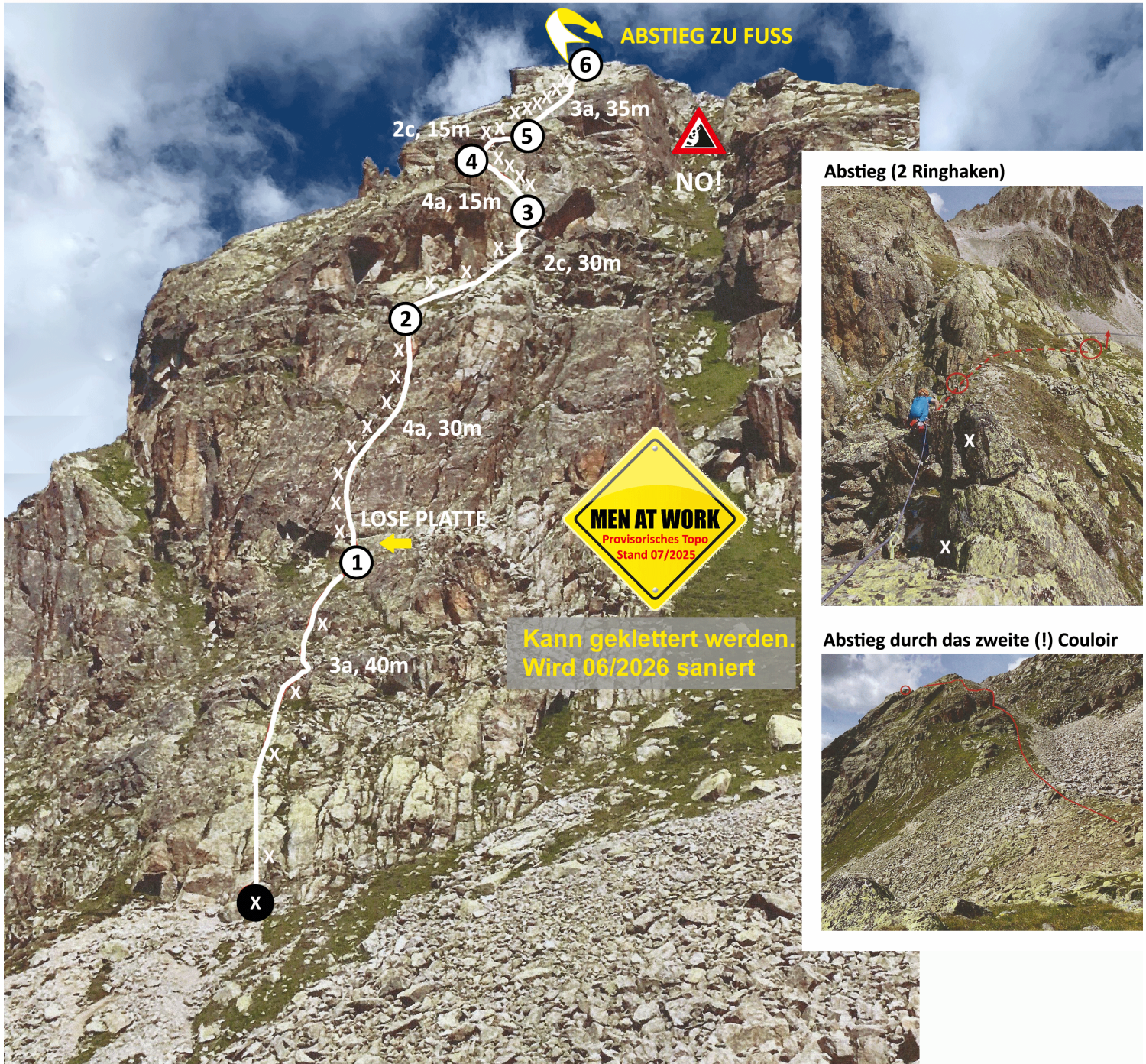
Abstieg (2 Ringhaken)